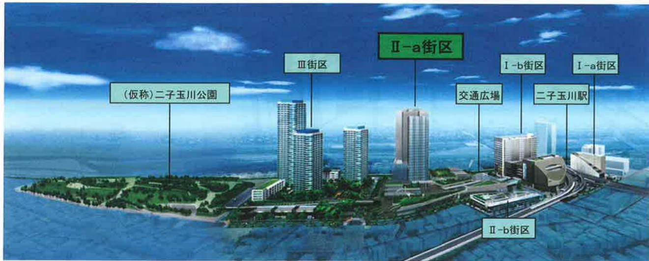
(仮称)二子玉川公園の図は、世田谷区が策定した「(仮称)二子玉川公園基本計画 平成22年6月」のイメージ平面図をもとに、当組合が描いたものです。

二子玉川駅から(仮称)二子玉川公園へと、都市から自然への移り変わりの中で、人工的なものから本当の自然へと、各種の要素が徐々に変化するメタファー(要素)としてシーケンス(連続性)を形成します。