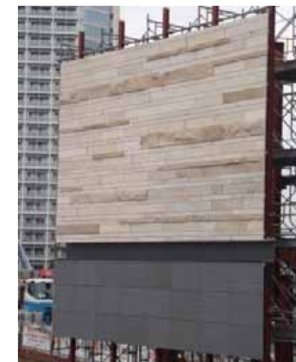
上：低層棟モックアップ

高層棟と低層棟の外壁の一部を実物大で作成し、色や質感を確認するとともに、設計担当や工事担当など関係者でデザインを確認し合うため