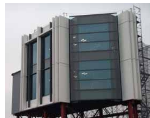
モックアップ設置中 上：高層棟モックアップ