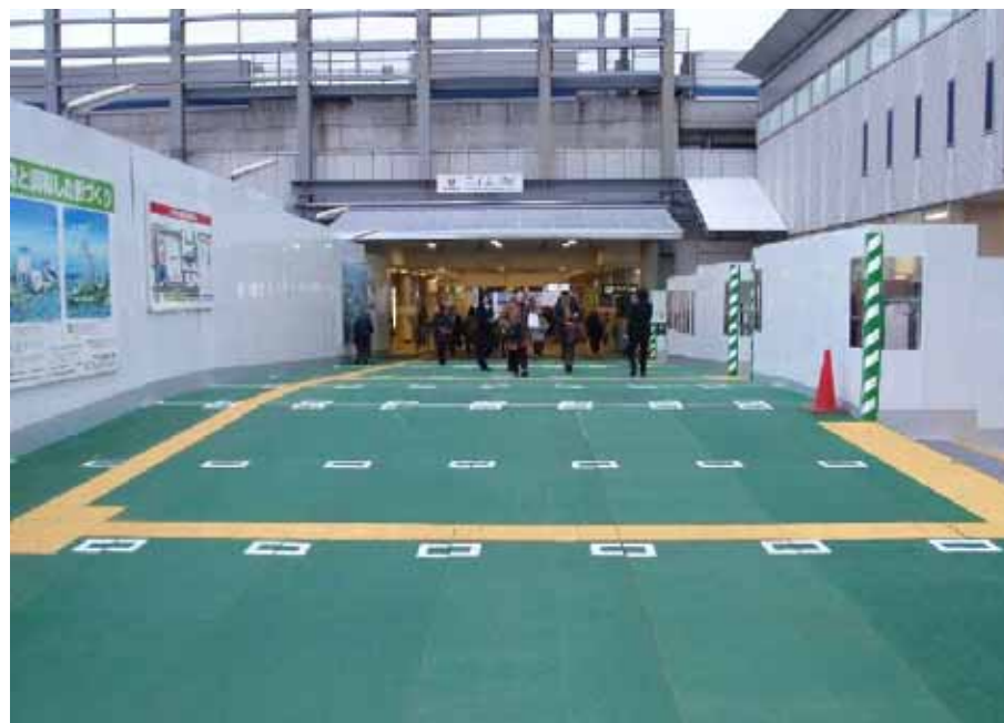
現状通路状況写真

平素より二子玉川東地区市街地再開発事業につきましてご理解とご協力をいただきましてありがとうございます。 下記の期間、再開発工事に伴ない歩行者通路が下図のように替わります。 皆様にはご不便をおかけ致しますが、ご理解・ご協力をいただきますようお願い致します。